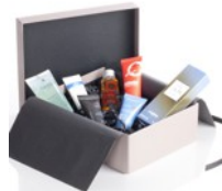
La Glossy Box pour homme, lancée en décembre.

Entre deux envois, pas question de délaissier les abonnées: les boxes cherchent à créer une communauté de clientes fidèles qui échangent entre elles, en particulier via les réseaux sociaux en ligne. Réactives sur Twitter, les boxes drainent également les fans sur Facebook: la page de la Glossybox compte ainsi près de 29.000 abonnées, celle de la JolieBox 27.700 tandis que My Little Box affiche 3700 fans mais sa grande soeur My Little Paris quelque 63.800.